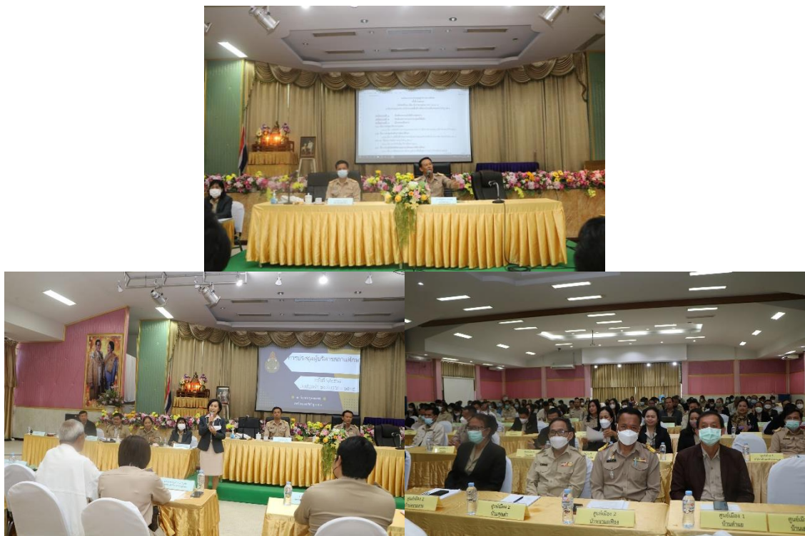
26 ธันวาคม 2565 ผอ.สพป.นภ. เขต 1 ประกาศและทำความเข้าใจในที่ประชุมประจำเดือนผู้บริหารสถานศึกษา ซึ่งกำลังจะเข้าสู่เทศกาลปีใหม่ เกี่ยวกับนโยบาย No Gift Policy ซึ่งอาจจะมี การให้ของขวัญอันจะก่อให้เกิดการทุจริตในหน่วยงาน