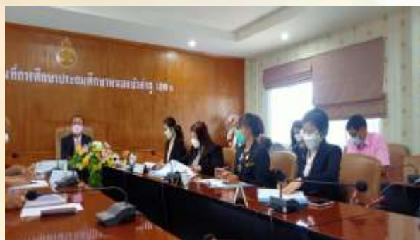
รับบริการตรวจราชการ เชิงประจักษ์ที่เขตพื้นที่การศึกษา และโรงเรียนกลุ่มเป้าหมาย